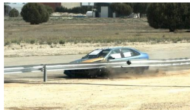
Essai : TB32 (voiture 1.500 Kg., 110 Km/h., 20°)