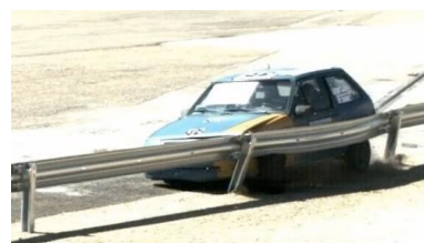
Essai : TB11 (voiture 900 Kg., 100 Km/h., 20°)